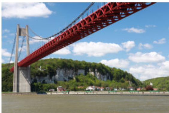
Pont de Tancarville

Suspendu sur la Seine près de l'Eure, ce pont est emprunté par environ 18 000 véhicules tous les jours. Ce flux de circulation en constante progression a obligé la CCI du Havre à entreprendre des travaux pour améliorer les accès sur les deux rives. Dans le cadre de ces aménagements, une station de relevage est mise en place par l'agence Telstar Ile-de-France .