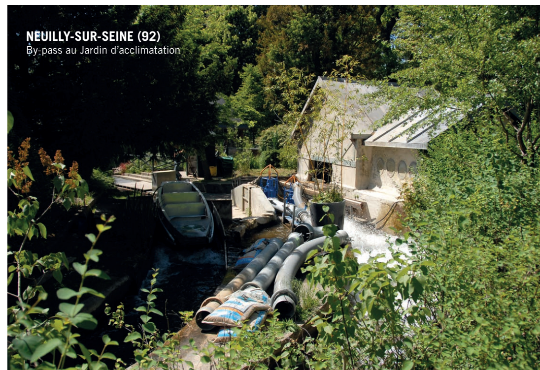
NEUILLY-SUR-SEINE (92) By-pass au Jardin d'acclimatation