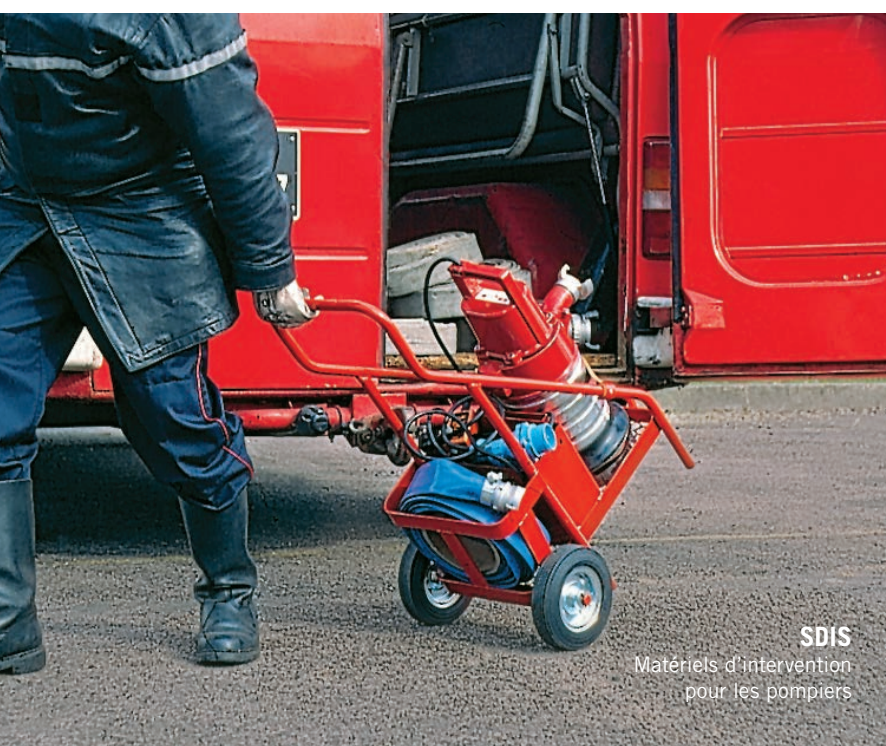
SDIS Matériels d'intervention pour les pompiers