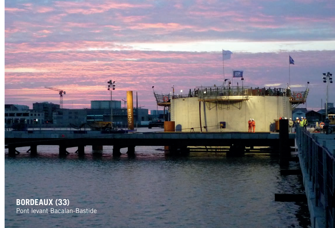
BORDEAUX (33) Pont levant Bacalan-Bastide