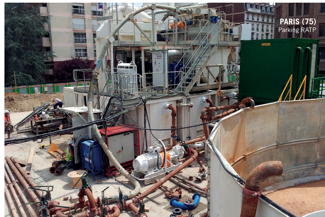
PARIS (75) Parking RATP