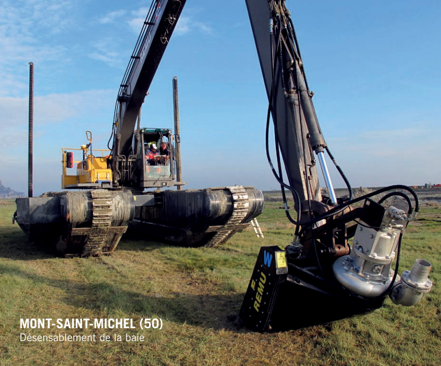
MONT-SAINT-MICHEL (50) Désensablement de la baie