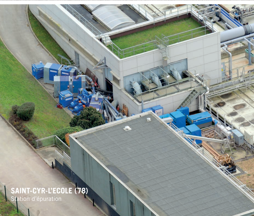
SAINT-CYR-L'ECOLE (78) Station d'épuration